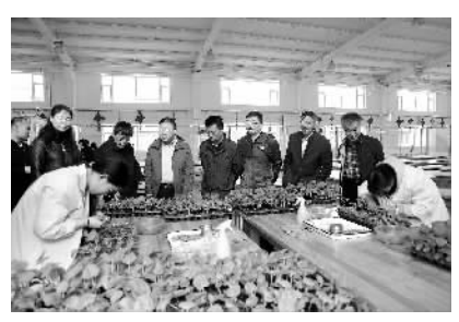
省教育厅副厅长战高峰视察大赛备赛情况