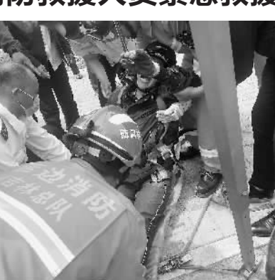
消防员救出井下被困人员 N14

新文化报讯(ZAKER吉林记者 杨威 通讯员 袁立鹏) 6月10日上午11时14分,延吉市铁南东明新城南侧,一名工人被困井底。延州州河南消防中队接警后,立即赶赴现场进行处置。到达现场后,经侦查发现该污水井道约有3米深,井底为圆形管道连接处,左右两边有连通的污水道,蓄水池内水深约15厘米,池内有大量淤泥。据了解,事发当时一名工人要对污水井进行检修,下井作业时,墙壁扶手脱落,跌落井底被困,且下肢无法移动。随后,现场指挥员组织队员架设救援三脚架,并对井下气体进行检测,确认井下环境安全后,消防员开始下井开展营救。消防员在井下将消防安全吊带给被困人员穿上,并戴好头盔,确认无其他危险的情况下,开始由外部消防员吊升被困人员。11时40分,井下被困人员被成功营救出来移交至120救护人员。